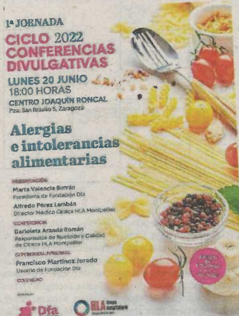
Cartel de la charla divulgativa.

La Clínica HLA Montpellier y la Fundación Dfa retoman las charlas de divulgación socio-sanitarias, aparcadas con la irrupción de la pandemia. En esta ocasión lo hacen con la organización del ciclo de conferencias sobre alimentación saludable y nutrición del proyecto Dfalimentación . Abrirá esta nueva etapa la conferencia titulada Introducción a las alergias e intolerancias alimentarias , que se desarrollará en el salón de actos del